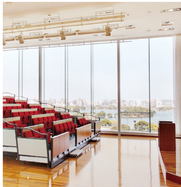
視聴覚教室 自動収納可能な机・椅子を完備しており、特別授業や講演会などを行います。 北側は全面ガラス張りとなっており大濠公園を一望できます。

校舎内は吹き抜けとなっており、天井から自然光が差し込む明るく開放的な空間です。 4階の生徒ホールのフロアは地中熱による冷暖房システムを備えており、友人と語り合う憩いの場となっています。