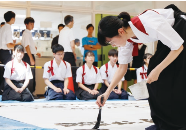
中高合同で行われる体育祭・文化祭を通じて、クラスの団結や学年の縦と横のつながりが強くなります。先輩の姿を見て学び、指導すべき後輩を持つことにより主体的に動き企画・実行する姿勢が養われます。