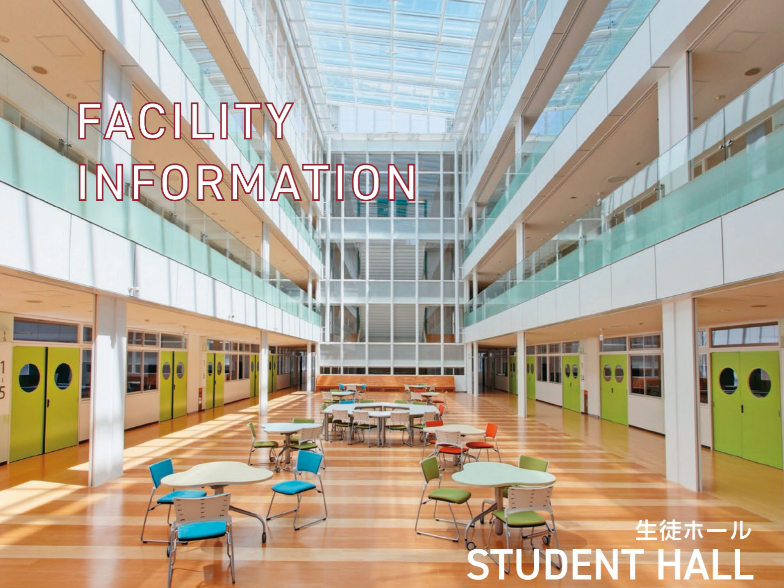
生徒ホール STUDENT HALL