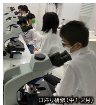
日帰り研修(中1・2月)