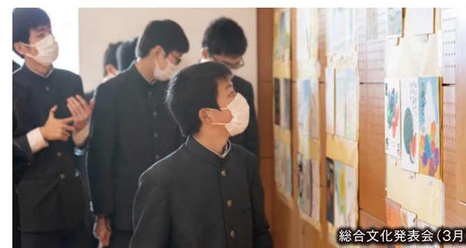
総合文化発表会(3月)