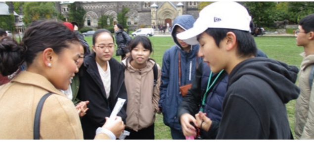
他言語・異文化にふれ、見聞を広めることを目的としています。令和6・7年度の修学旅行は、シンガポールにて実施します。 *写真は、以前実施していたカナダへの修学旅行の様子です。