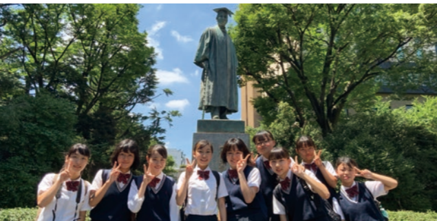
東京大学、京都大学をはじめとした関東、関西の大学キャンパス見学を高2進学前の春に設定しています。受験に向けての進路意識、目的意識が高まります。