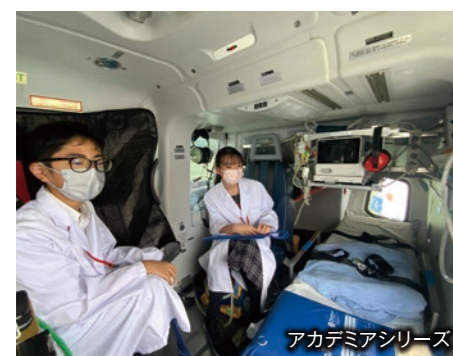
アカデミアシリーズ