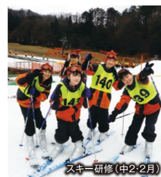
スキー研修(中2・2月)