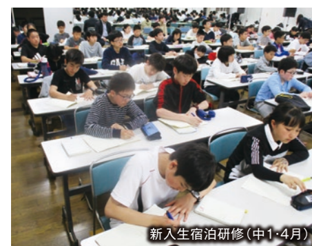
新入生宿泊研修(中1・4月)